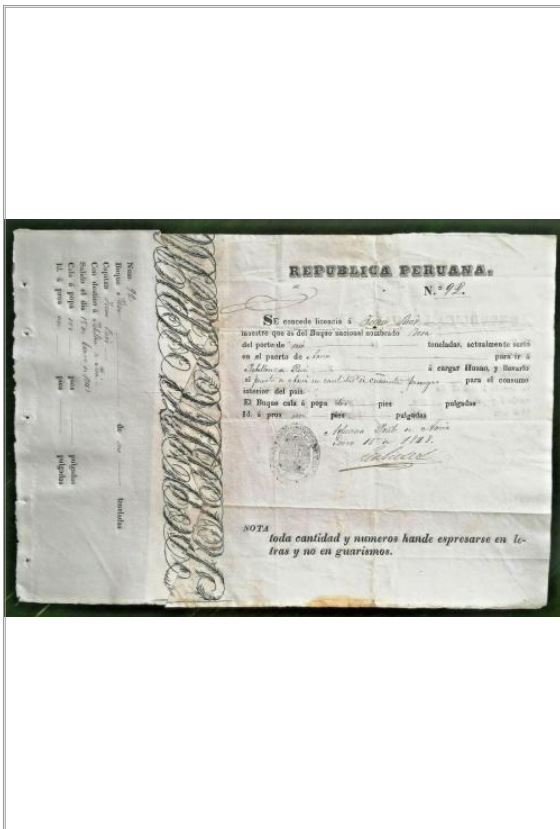
Imágen: Vista Anterior