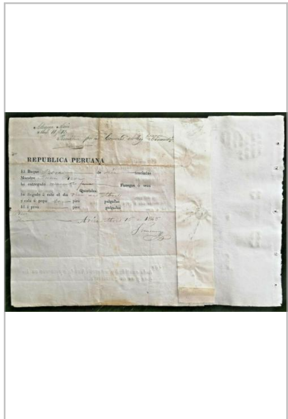
Imágen: Vista Posterior